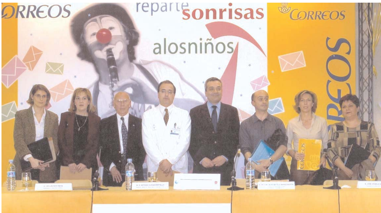
Todos los firmantes del acuerdo posaron para las cámaras a la finalización del acto.

de colegios de las provincias donde se celebren las fiestas, la elaboración de escritos de contenido divertido, tales como: cuentos, adivinanzas, poesías, dibujos, chistes, etc., facilitando a los niños impresos y sobre especiales. Más tarde, Correos se